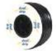
9. Dual Drip \varnothing 16 , 8mil 30cm, 2,1L/H - 250m