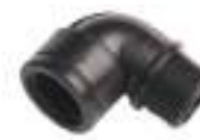
M-F Elbow \varnothing 3/4'' Pcs.1