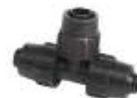
Tees PN4 \varnothing 20 Pcs.1