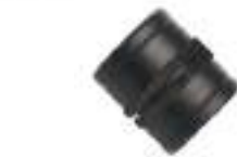
1. F-F Coupling \varnothing 3/4'' Pcs.3