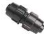
Coupling PN4 \varnothing 20 Pcs.1