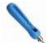
7. Hole Puncher \varnothing 3.6'' Pcs.1