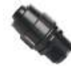
4. Male adaptor. \varnothing 20 3/4" Pcs.1