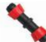
Dripline coupling \varnothing 16 Pcs.5