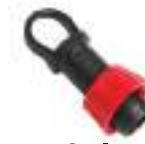
10. End Plug \varnothing 16 Pcs.15