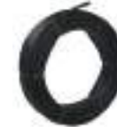
5. Pipe PEBD PN6 \varnothing 20 25m