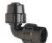
6. Elbow PN4 \varnothing 20 Pcs.2