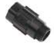
3. MF Press. regul. \varnothing 3/4 1bar Pcs.1