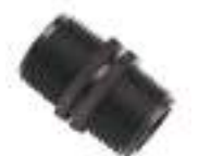
Nipple \varnothing 3-4'' Pcs.1