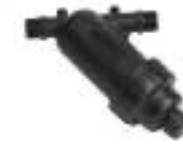
2. Filter 120 MESH Pcs.1