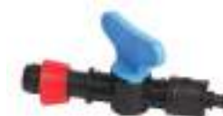
8. Valve Pcs.15